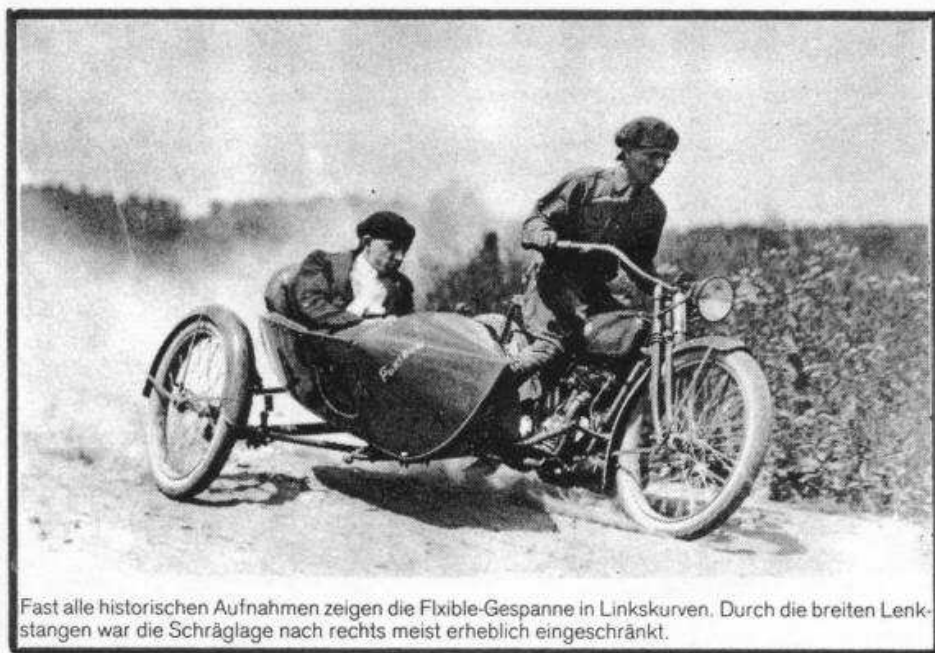
Fast alle historischen Aufnahmen zeigen die Flxible-Gespanne in Linkskurven. Durch die breiten Lenkstangen war die Schräglage nach rechts meist erheblich eingeschränkt.